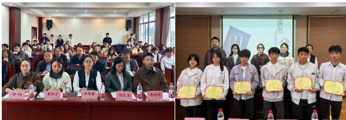
图 2 第八期“阅读之星”活动