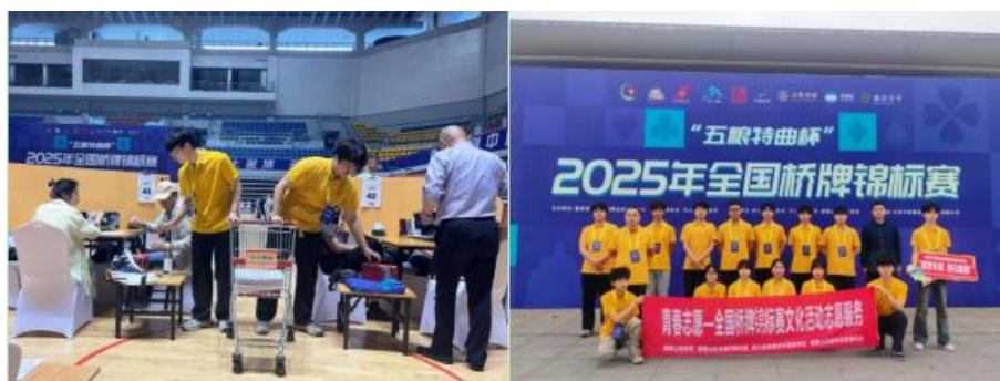
图 21 重点志愿服务

重点志愿服务： 组织青年志愿者参与“五粮特曲杯”2025年全国桥牌锦标赛志愿服务；依托“我在劳动中成长”活动，组织学生深入地方街道、社区开展卫生清扫等服务，传递爱心温暖，强化社会责任感。