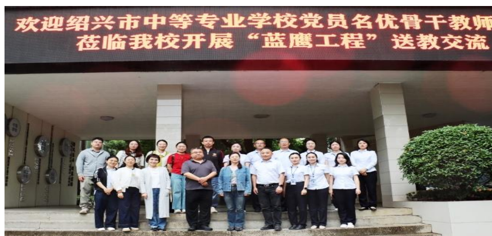
图 26 送教交流活动

此次送教交流活动，为两校搭建了深度合作与交流的平台，有力促进教育资源互补与共享，为推动教育高质量发展注入新动力。