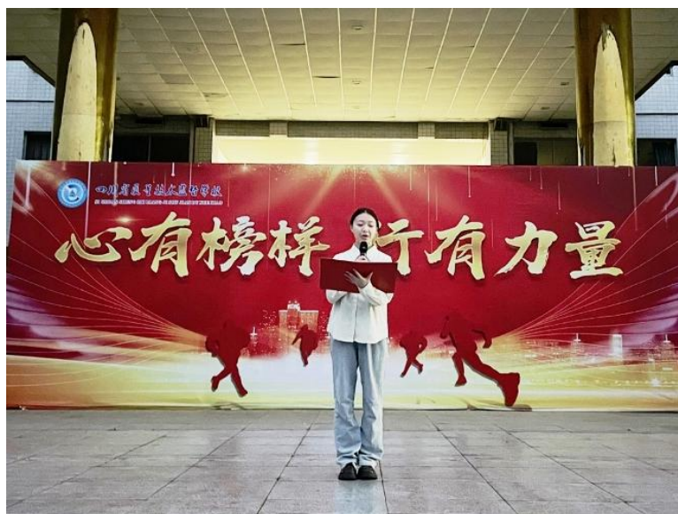
图 11 心有榜样 行有力量

红色主题活动： 4月1日，第四党支部联合教职工团支部及40名团员学生共赴峨眉山烈士陵园，开展“缅怀革命先烈，弘扬爱国精神”主题党日活动，通过奏唱国歌、肃立默哀、重温入党誓词、敬献鲜花等环节，厚植家国情怀；12月9日，举办“以我青年之声铸我强国之梦”纪念“一二·九”爱国运动90周年朗诵比赛暨主题教育实践活动，引导学生铭记峥嵘岁月、传承红色精神。