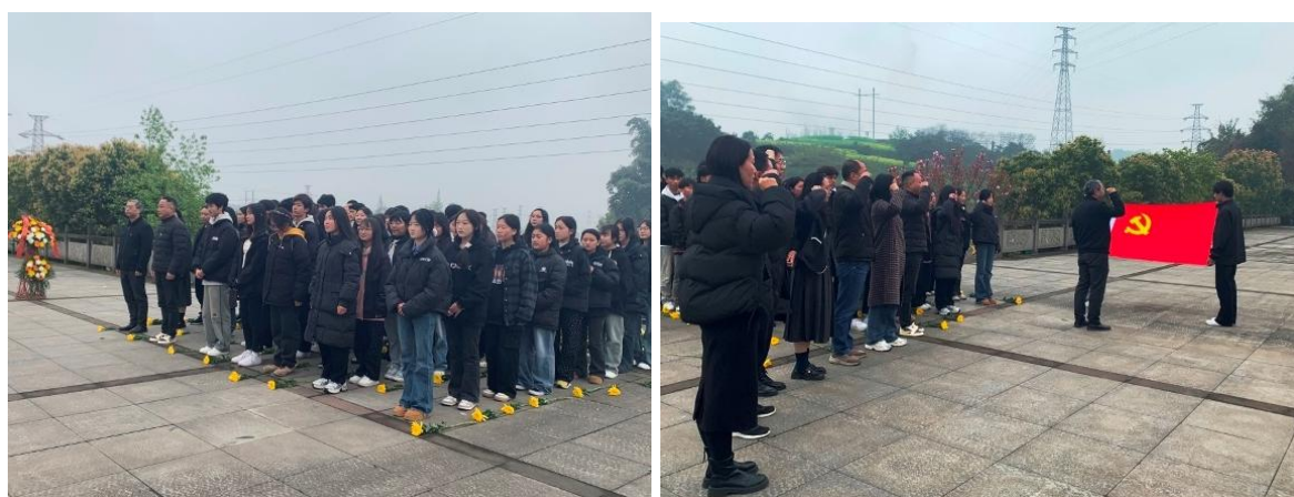
图 12 学校第四党支部开展主题党日活动

红色主题活动： 4月1日，第四党支部联合教职工团支部及40名团员学生共赴峨眉山烈士陵园，开展“缅怀革命先烈，弘扬爱国精神”主题党日活动，通过奏唱国歌、肃立默哀、重温入党誓词、敬献鲜花等环节，厚植家国情怀；12月9日，举办“以我青年之声铸我强国之梦”纪念“一二·九”爱国运动90周年朗诵比赛暨主题教育实践活动，引导学生铭记峥嵘岁月、传承红色精神。