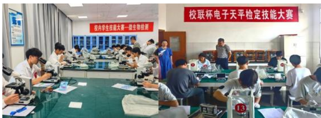
图 18 校内学生技能大赛

技能竞赛赋能： 6月11日，举办以“一技在手，一生无忧”为主题的第十三届校内学生职业技能竞赛，共设化学分析、仪器分析、食品微生物检验、精密测量、电子天平检定、餐巾折花、智能财税基本技能、老年人辅助用具的使用、电梯维修保养、计算机速录、硬笔书法比赛等11个赛项，以赛促学提升学生职业技能。