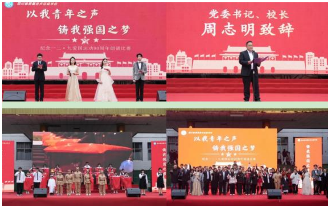
图 13 纪念“一二·九”爱国运动主题朗诵比赛