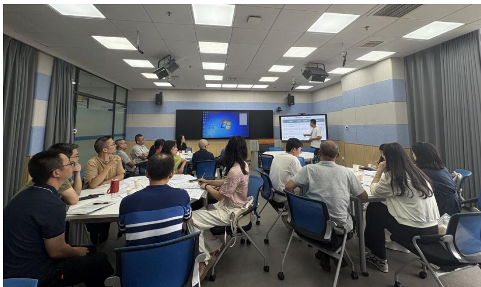
图 23 人才培养方案与课程体系建设研讨会

专业课程标准研制、教学资源建设等核心议题深入研讨，形成跨校资源共建共享模式。双方聚焦食品、化工、农学等专业交叉领域，共享教学标准与并初步构建课程互融机制，今后拟在课程标准框架、分领域教学案例库及实践教案模板开发建设等领域开展深度合作。此次联合教研活动有效打破了区域职业教育资源壁垒，反哺了学校食品安全与检测技术、食品检验检测技术等专业的课程更新，有效推动学校教育开放向实质共享迈进。