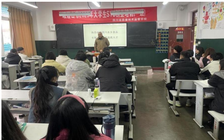
图 10 导师课堂

有效缩短学生职场适应期；二是以企业真实人才标准反哺教学，为课程优化提供行业参照；三是强化属地企业联动，为乐山食品产业储备技术技能人才奠定基础。