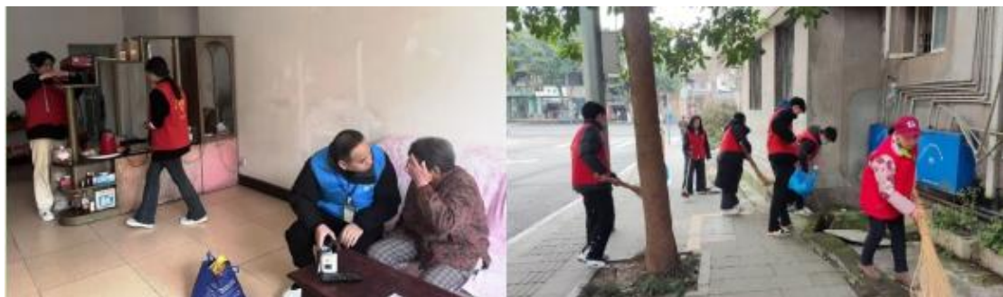
图 15 开展“我在劳动中成长”活动

“十八而志，筑梦远航”主题教育活动，强化学生成人意识与社會责任感，深化家校合作，推动党建带团建深度融合。