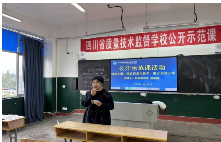
图 4 校级公开示范课