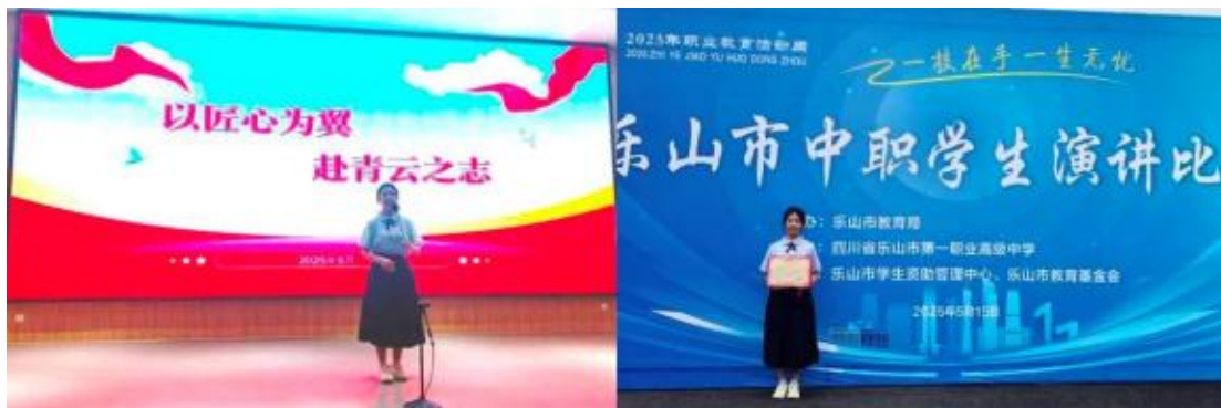
图 19 2025 年乐山市中职学生演讲比赛获二等奖

社团实践助力： 2025 年共有 29 个社团开展活动，共计开展活动 317 余次，开课 317 小时，1500 余人次参加，举办三次协会成果展示活动，通过社团活动夯实学生专业基础、培育工匠精神。