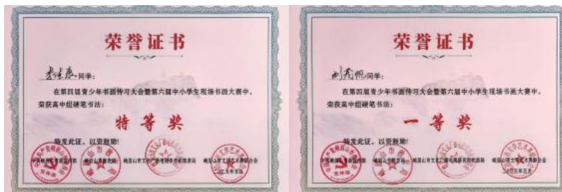
图 17 “峨眉山市第四届青少年书画传习大会暨第六届中小學生现场书画大赛”获奖