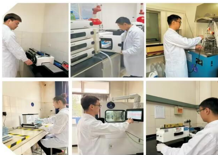
图 8 标准化实验室

的与时俱进；其二是学生培养方面，学生在学习过程中可直接进入企业实地，学习内容与岗位零距离对接；其三是师资培养方面，通过校企师资“互派互聘”，加强教师队伍建设，深化教育教学改革，打造高水平“双师型”教师团队。