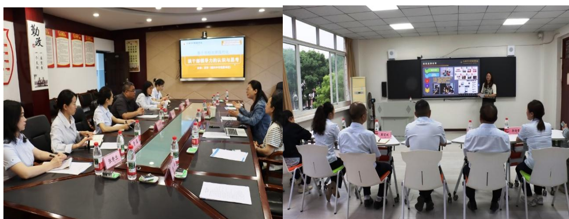
图 25 送教交流活动

校治理与干部领导力提升》《融合党建软实力，打造专业硬品牌——党支部与专业系融合建设经验分享》《光耀前行向阳路，培根实践育新人——学校德育品牌建设下的德育工作实践》等专业课程，为学校相关人员带来前沿理念与实践经验。