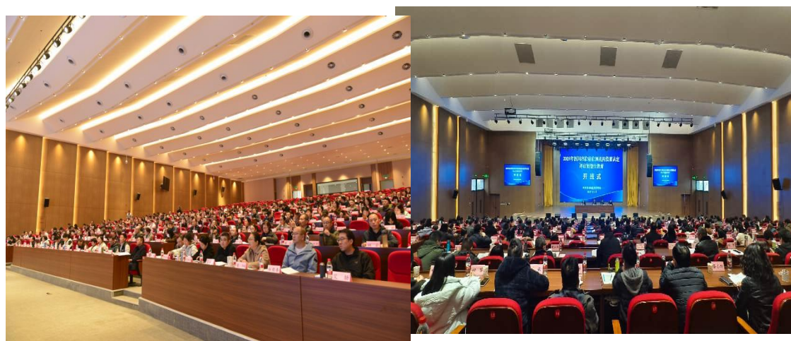
图 22 培训现场

主动对接地方产业链、重点行业和企业需求，开展订单式、定向式及岗位能力提升培训，实现培训内容与岗位标准紧密衔接。与企业、检测机构建立合作机制，共同制定培训方案、共建实训基地，促进培训成果更好地转化为实际生产力。