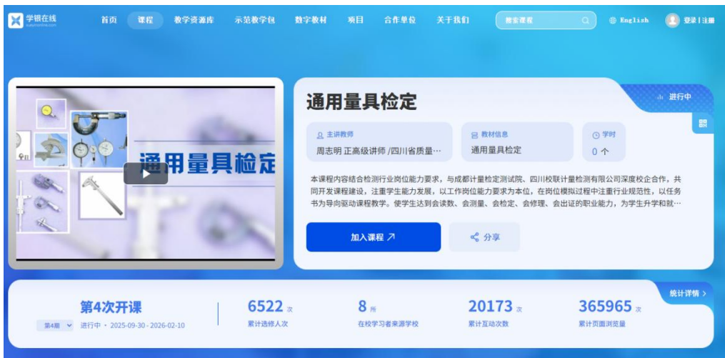
图5 《通用量具检定》课程门户信息

学校积极推进教育教学数字化转型，与超星公司深度合作，依托学银在线平台开发建设精品在线开放课程资源。目前已建成《通用量具检定》《食品质量检验》两门核心课程，实现跨区域资源共享与应用推广。其中，《通用量具检定》累计开课4期，覆盖8所学校6522人次，页面浏览量达365965次，互动量20173次；《食品质量检验》累计开课3期，惠及14所学校12,017名学习者，页面浏览量为70,012次，互动量1,430次。课程开发紧密对接行业标准与企业实际需求，与成都计量检定测试院、四川校联计量检测有限公司协同设计，融入岗位任务案例和规范性操作指南，为学生提供“会读数、会测量、会检定、会修理、会出证”的沉浸式学习资源。优质数字课程的推广不仅提升了校内教学效率，更辐射省内外同类院校，有效促进了校际教学资源共享与专业能力协同提升。