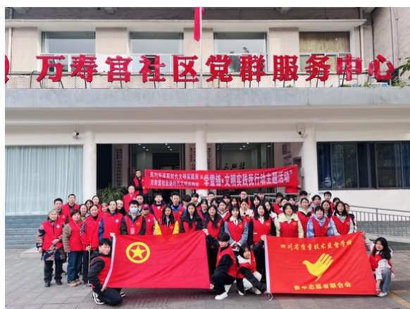
图 20 志愿服务

常态化志愿服务： 学习弘扬雷锋精神，深入开展学雷锋和志愿服务活动，保持每月校内外持续开展志愿服务的常态，全年累计开展志愿活动 42 次。