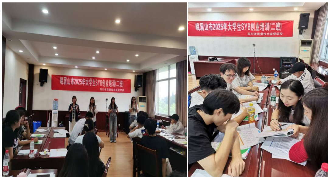
图 9 创新培训