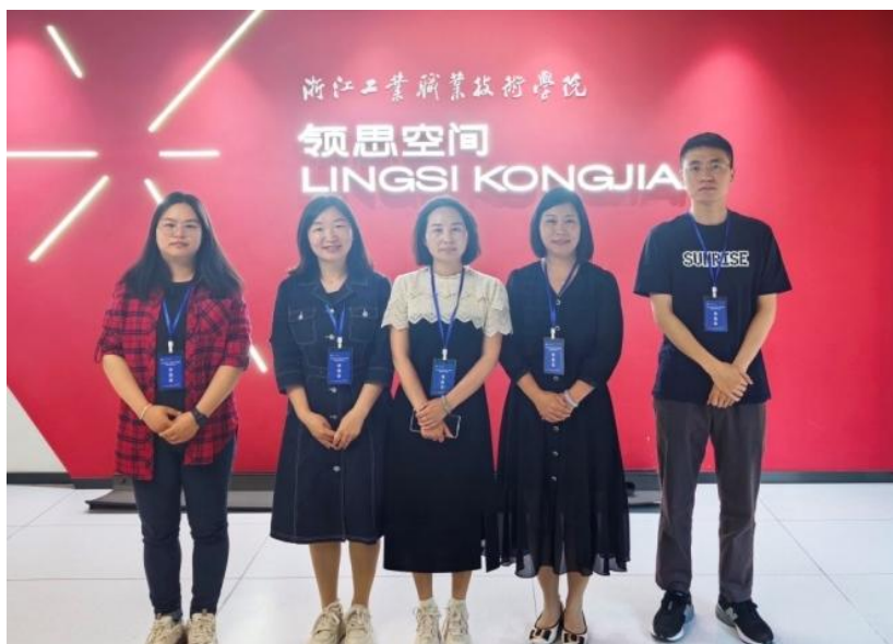
图 24 蓝鹰之师教师团队赴绍兴交流