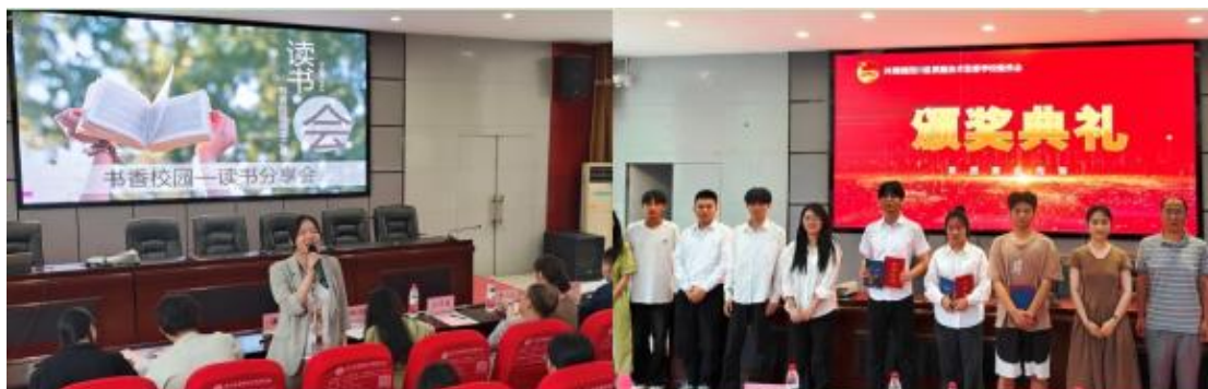
图 14 第七期“阅读之星”活动

书香校园建设： 每学期开展一次“书香校园·阅读之星”读书分享会，共计 200 人参加活动，共评选出 9 名阅读之星，营造浓厚读书氛围，引导学生爱读书、读好书、善读书。